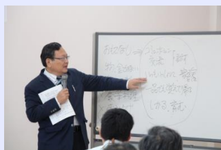
昨年度の民泊普及研修会

この事業を理解していただき、参加していただけるよう各地域にて住民説明会などを行っていきます。何名からでもお伺いいたしますので、事務局までご連絡ください。（説明会は随時受け付けております。お気軽にご連絡ください）