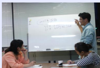
比和地区(8名)にて勉強会